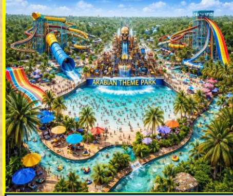
Arabic Water Kingdom