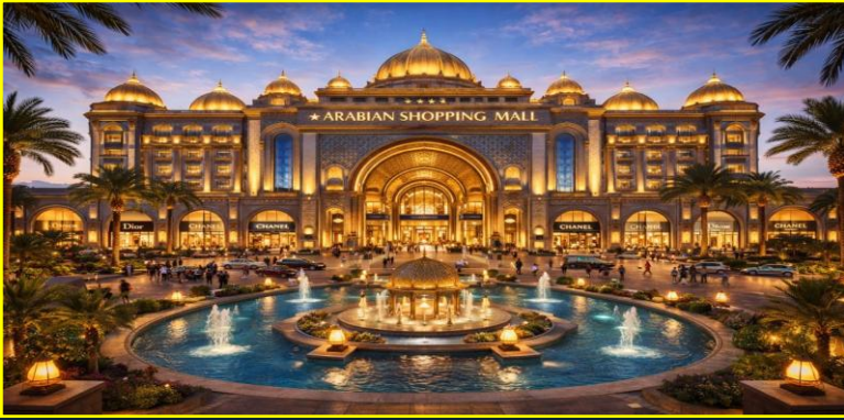
Arabic shopping Mall