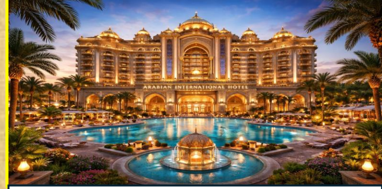
Arabic International Hotel